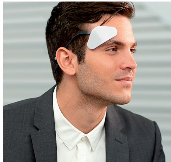
„Thync“ macht müde Männer munter.

ein Termin ansteht. Dann leuchtet der große Schmuckstein. Durch eine Schüttelbewegung lässt sich ein Foto auf dem Smartphone auslösen, das mit dem Ring per Bluetooth verbunden ist. In den USA sorgt ein neues Wearable für Aufsehen, das die Gemütslage verändern will. „Thync“ wird wie ein großes dreieckiges Pflaster