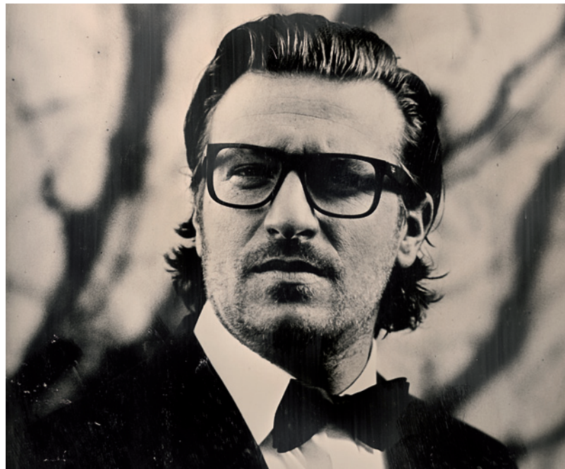
Parovoz Stelar hat sein eigenes Genre erschaffen.

In den Neunzigerjahren absolviert Füreder ein Design-Studium in Linz. Er erstellt Flyer für Techno-Events und Clubs, putzt aber auch Bierzapfanlagen in Linzer Beisln. Seine visuelle Kreativität beeinflusst auch seine musikalische. „Ich bin ursprünglich wie ein Grafiker oder Maler an die Musik herangegangen, mit dem Interesse, die alten Stücke zu zerlegen und experimentell damit zu arbeiten.“ Mit einer Grundidee, aufgebaut auf Beats und Samples, entwickelt er neue Werke. Ähnlich geht er mit aktuellen Trends oder Einflüssen um. Manchmal findet er über Wochen keinen passen-