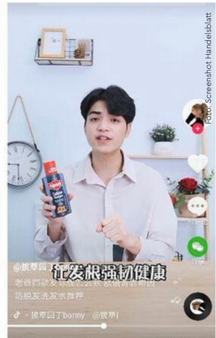
Beim heurigen Shopping-Festival „818“ der chinesischen TikTok-Schwesterfirma Douyin wurden beispielsweise etwa 30.000 Flaschen eines deutschen Shampoos verkauft. (Quelle: Handelsblatt)

lautet: Jeder kann kochen. Ein TikTok-Nutzer nach dem anderen hängte sein Liedchen an, am Ende dauerte das ganze 72 Stunden und wurde über eine Milliarde Mal aufgerufen, quasi unter dem Motto: Jeder kann auf TikTok erfolgreich sein.