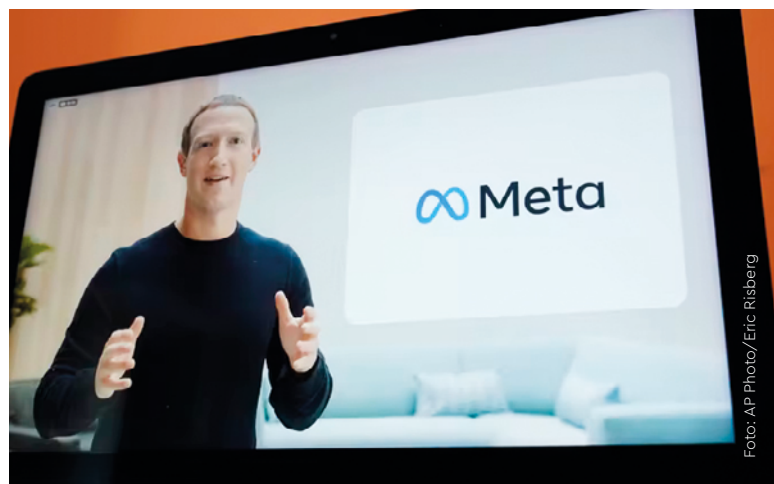
Facebook-Gründer Mark Zuckerberg zeigt seine neue Dachmarke.