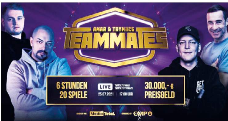
Kai Pflaume und MontanaBlack gewannen die zweite Ausgabe von „Teammates“ gegen Amar und Trymacs (v. r. n. l.).

Auf der bei Gaming-Fans führenden Plattform Twitch haben die beiden Influencer Trymacs und Amar eine Spielshow namens „Teammates“ gestartet. Sie treten jeweils gegen zwei andere bekannte Online-Persönlichkeiten an. Damit bringen sie einen Klassiker des linearen Fernsehens auf die Streaming-Geräte. Das Format ähnelt „Joko und Klaas gegen ProSieben“ oder „Schlag den Star“ (früher „Schlag den Raab“). 220.000 Zuschauer zur selben Zeit sind zwar nur ein Siebtel von Joko und Klaas. Doch für Twitch sind die Zahlen überdurchschnittlich und markieren den drittgrößten Livestream aller Zeiten in Deutschland. Enorme Spannung und ein Preisgeld in Höhe von 30.000 Euro hielten die Zuschauer über sieben Stunden lang in ihrem Bann. Anders als bei klassischen TV-Shows blickt Teammates auch hinter die Kulissen. Dagegen floppte ein anderer populärer Streamer mit einer Spielshow: Jens „Knossi“ Knossalla präsentierte am 23. Oktober die Pilot-Episode von „Prime Time Games“. Während Knossis frühere Live-Ereignisse wie die Angel-, Horror- und Mittelalter-Camps jeweils 200–300.000 Zuschauer schafften, erreichte seine neue Show lediglich ein Zehntel davon.