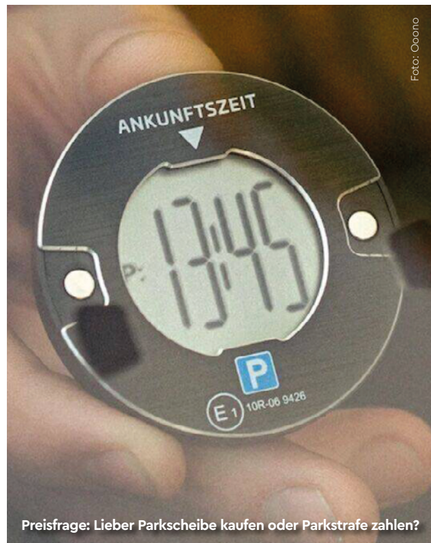
Preisfrage: Lieber Parkscheibe kaufen oder Parkstrafe zahlen?

Wer sich lieber mit Hilfe seines Autos als seines Körpers bewegt, kann neuerdings Parkstrafen intelligent vermeiden. Die dänischen Anbieter des Verkehrswarners Oono bieten neben Blitzer- und Unfallwarnern nun auch eine smarte Parkscheibe an. Sie erkennt dank integrierter Sensoren und patentierter Algorithmen, wann das Auto abgestellt wurde, und stellt die Uhr entsprechend ein. Die mit einem Durchmesser von sechs Zentimetern eher kleine Parkscheibe ist aus Aluminium gefertigt und wird von einer Knopfzelle mit Strom versorgt. Das 40 Gramm leichte Gerät hält magnetisch an zwei selbstklebenden Füßen für die Frontscheibe und berücksichtigt die jährliche Zeitumstellung von Sommer- zu Winterzeit. Die Scheibe kostet Euro 49,- und ist vom deutschen Kraftfahrt-Bundesamt und TÜV zertifiziert.