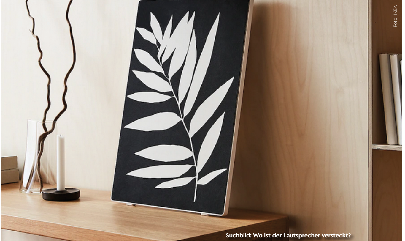
Suchbild: Wo ist der Lautsprecher versteckt?